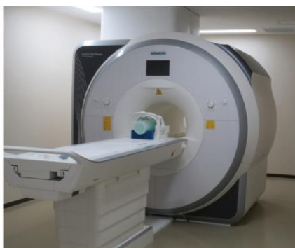
大学施設内研究用MRI装置